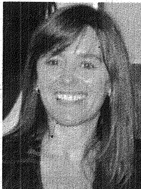
Juliana Di Tullio, diputada nacional por la provincia de Buenos Aires, disertará el martes en Caleta Olivia.

En Buenos Aires, al ser consultada sobre la actualidad de las políticas de género, a manera de anticipar detalles de la disertación que ofrecerá en Caleta, Di Tullio destacó que “las leyes de salud reproductiva, de educación sexual