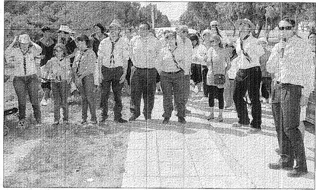
frente a la institución Liceo Militar General Roca, entre quienes se encontraron el cuerpo de Scout de Nuestra

Por la realización de los diferentes eventos evocativos al aniversario barrial, el representante barrial agradeció al Municipio por el apoyo brindado y también lo hizo extensivo a quienes participaron del acto oficial celebrado en el monumento de los Polacos, ubicado