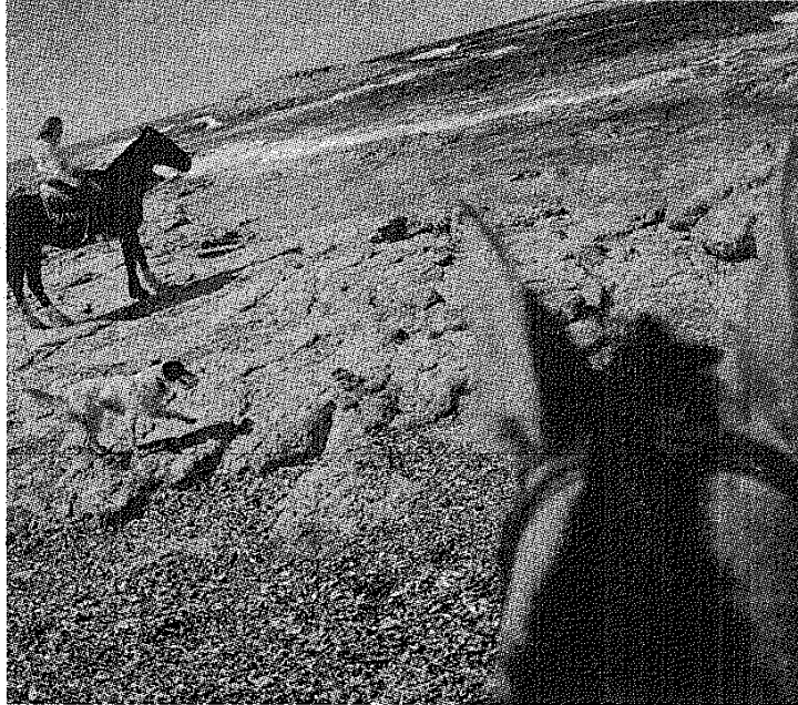
Bahía Bustamante muestra: Albatros en volar, petreles, fideles, alcar y pampas. Que way to see it all, and the wildlife there, is on horseback.

En su nota, la periodista Danielle Pergament resalta la biodiversidad "única" del parque como una propuesta diferente. "Siempre me dijeron que las lagartijas y los pingüinos vivían separados por varios grados de latitud. Pero allí estaban, pequeñas partes de un ecosistema insólito pero que funcionó perfectamente por siglos: el gracioso pato vapor que puede alcanzar una gran velocidad pero nunca vuela, los petreles gigantes que se lanzan desde el cielo momentos después de que los