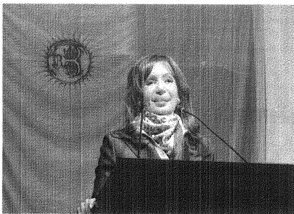
La Presidenta Cristina en sede Gremial 1° Junio 2009