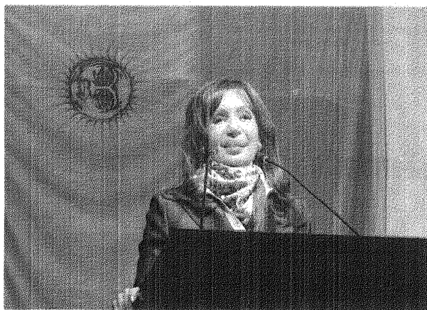
La Presidenta Cristina en sede Gremial 1° Junio 2009