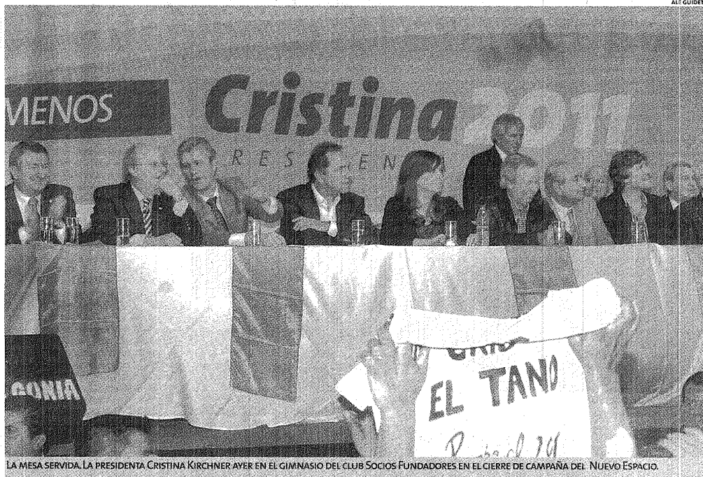
LA MESA SERVIDA. LA PRESIDENTA CRISTINA KIRCHNER AYER EN EL GIMNASIO DEL CLUB SOCIOS FUNDADORES EN EL CIERRE DE CAMPAÑA DEL NUEVO ESPACIO

Cinco mil personas corearon el nombre del fallecido ex presidente Néstor Kirchner y le pidieron a la presidenta que vaya por la reelección en los próximos comicios. Pero ella hizo silencio.