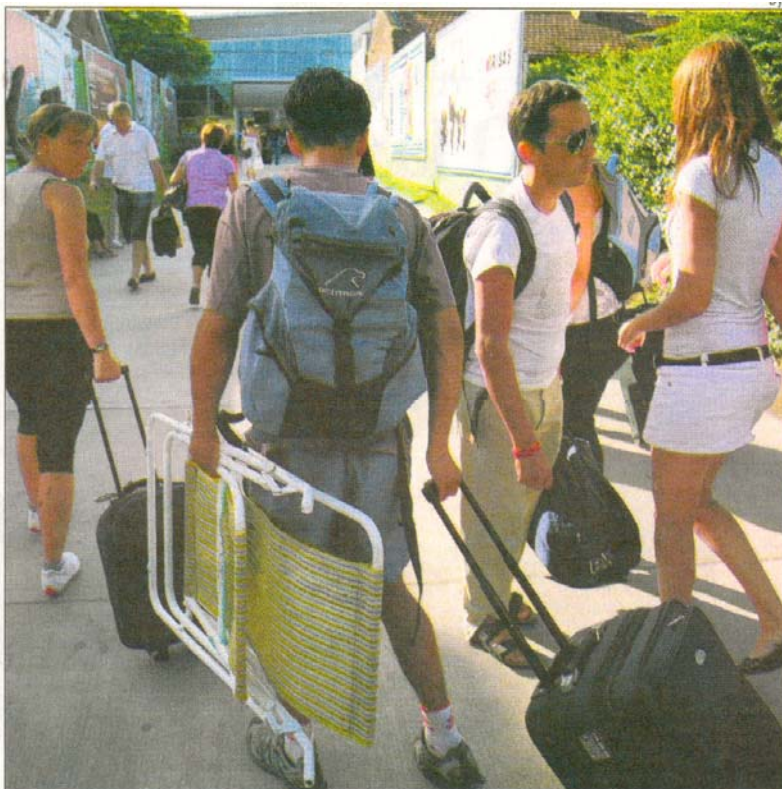
Los sectores que más subieron, de acuerdo al Indec, fueron esparcimiento, indumentaria y servicios.

Para el organismo oficial los alimentos en apenas subieron 0,3%. Se observaron subas de 2,1% en aceite y grasas, 1,7% en productos lácteos y huevos, 1,5% en bebidas e infusiones, y 1,5% en bebidas e infusiones, 0,7% en frutas, y