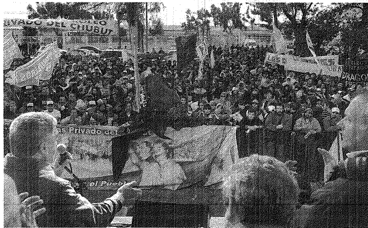
LA ÚLTIMA ARENGA. LAS CARTAS YA ESTÁN ECHADAS. EL OFICIALISMO CERRÓ SU CAMPAÑA EN COMODORO RIVADAVIA.

El candidato a gobernador por el oficialismo brindó un encendido discurso. También habló el gobernador Mario Das Neves, quien dijo que si su sector gana el domingo será el próximo Presidente de la Nación.