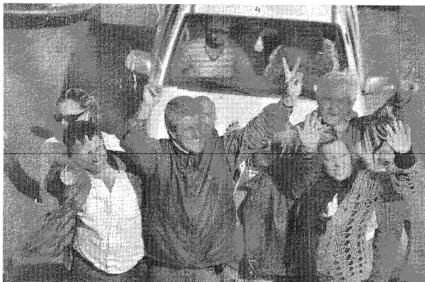
El candidato a gobernador del FpV estuvo ayer por la mañana en Comodoro y luego encabezó una masiva caravana en Puerto Madryn.

“No es casualidad que en Catamarca, donde gobernaba el radicalismo hace 20 años y se decía que iba a ser la primera derrota del kirchnerismo, el domingo se obtuvo un contundente triunfo,