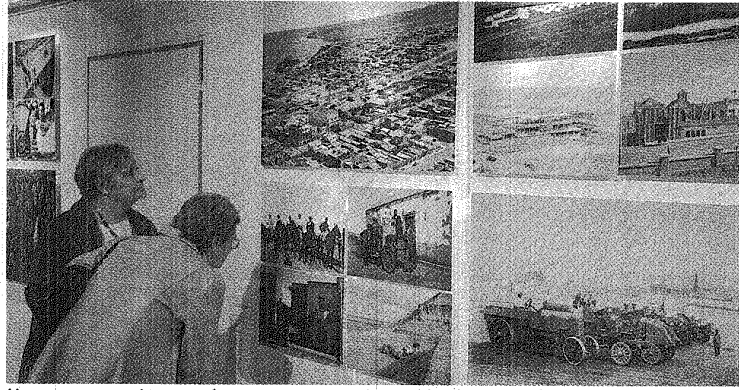
MUESTRA Y MEMORIA. LA EXPOSICIÓN INCLUYE FOTOS DE LA DÉCADA DEL 20 QUE FORMAN PARTE DE UN FONDO DOCUMENTAL.