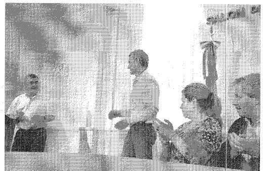
Mario Das Neves se atribuyó la victoria, más allá de que dos tercios de Chubut le dieron la espalda.