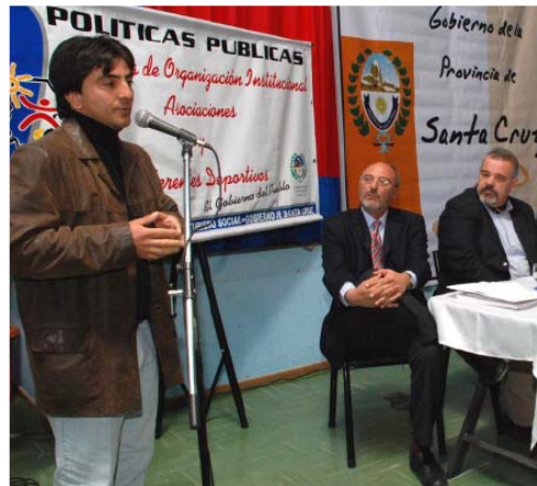
El Intendente gregorense dialogó con Prensa Libre.

Entre otros temas, el Intendente de Gobernador Gregores comentó: «Venimos manteniendo unas cuantas charlas con empresarios de todo tipo, en el día de ayer tuvimos una reunión que estaba pendiente con una empresa canadiense, estuvimos con la gente de Pan American Silver que tiene capitales en nuestra provincia a través de la mina Manantial Espejo, y estaría dispuesta a poner una importantísima suma de dinero para el interconectado y esto para