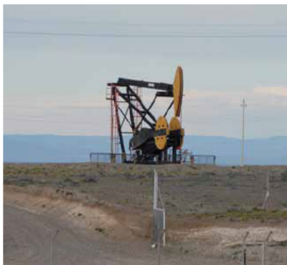
Los chinos interesados en la Patagonia.

fusiones y compras de empresas por más de U$S 22.800 millones, y se superó la anterior marca, que había sido en 1999 (U$S 20.500 millones) cuando se vendió YPF. ■