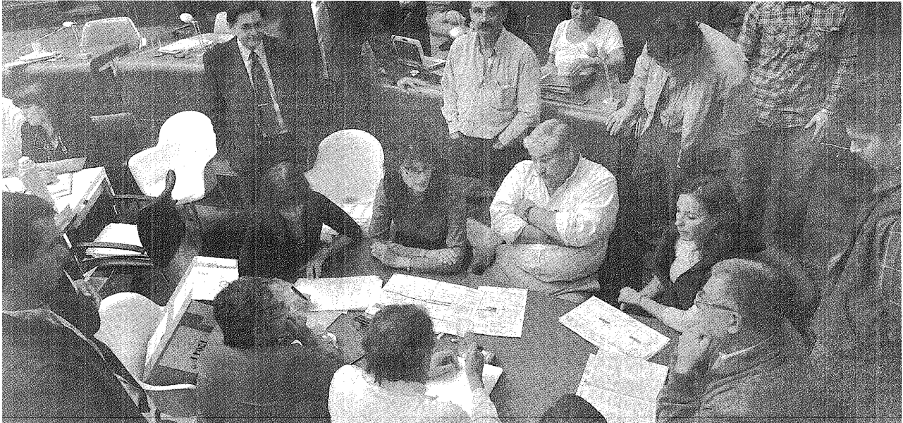
DÍA CLAVE. EL TRIBUNAL REVISANDO LA MESA 1204, FEMENINA, EN DONDE NO ESTABAN LOS VOTOS. HOY ES UN DÍA DE DEFINICIONES EN EL RECuento QUE SE LLEVA ADELANTE EN LA LEGISLATURA CHUBUTENSE.

El polémico escrutinio definitivo llegó a un día clave. Se espera que concluya la contabilización de los votos para conocer al ganador. Pero también se aguardan resoluciones tanto del Superior Tribunal de Justicia como del Tribunal Electoral Provincial para clarificar cuántas urnas quedan anuladas y si habrá elecciones complementarias o no.