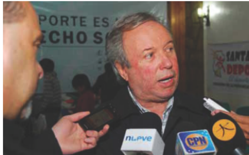
“Será la sociedad la que sepa juzgar”, dijo Peralta.

El gobernador Peralta dijo no entender los paros en medio de las paritarias y cargó contra los sindicatos que a nivel nacional cuestionan al Gobierno, aludiendo a la CTA; también cargó contra la oposición local. Además, confirmó la asunción de Urricelqui, Vuckovic y Córdoba para el 5 de abril.