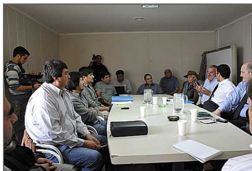
Largas horas de discusión derivaron en una mejora sustancial de la primera propuesta

El Gobierno provincial mejoró el aumento salarial al sector docente. Ofreció un 25 % a pagar de manera escalonada, en abril un 12 %, en julio un 8 % y septiembre un 5 % con retroactivo a marzo, a pagarse este último en dos cuotas en los meses de mayo y agosto. El gremio analizará la propuesta en congreso, mientras que hoy y mañana se realiza una medida de fuerza de 48 horas de paro.