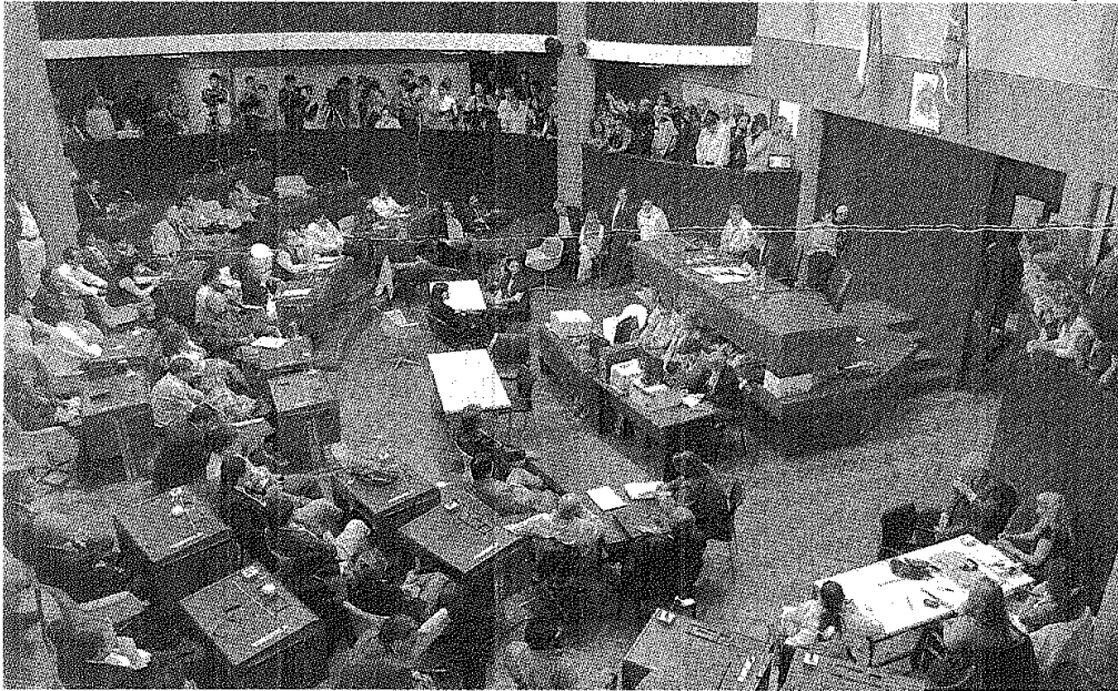
EL ESCRUTINIO TERMINÓ PERO TODAVÍA NO HAY UN GANADOR PROCLAMADO.