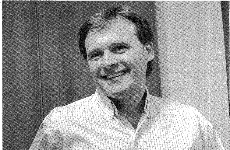
REFLEXIÓN. "SOY PROCLIVE AL DIÁLOGO Y OBJETIVOS COMUNES", DIJO MAC KARTHY. INSISTIÓ EN HABLAR CON NACIÓN.

También lamentó que por lo sucedido a nivel electoral ya haya algunas