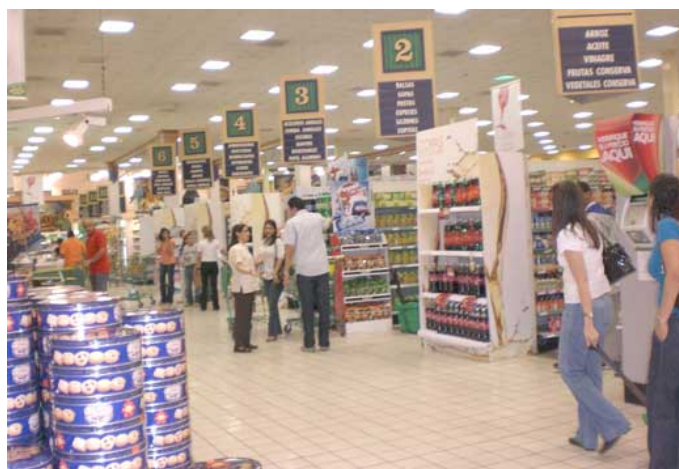
La actividad supermercadista

Las ventas en supermercados radicados en la provincia de Buenos Aires aumentaron un 17 por ciento medidas en facturación, lo que estuvo acompañado por un incremento en la producción de alimentos y bebidas, según un informe difundido por el ministerio de la Producción.