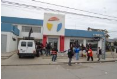
Imágenes de la protesta de ayer frente al canal TV Fuego.

Río Grande.- Durante la jornada de ayer, dirigentes del Sindicato Argentino de Televisión, delegados de los canales y trabajadores de televisión, se manifestaron en las puertas de la empresa TV Fuego de Río Grande. Reclamaron el encuadre de quienes se desempeñan en el tendido de cables y del personal administrativo.