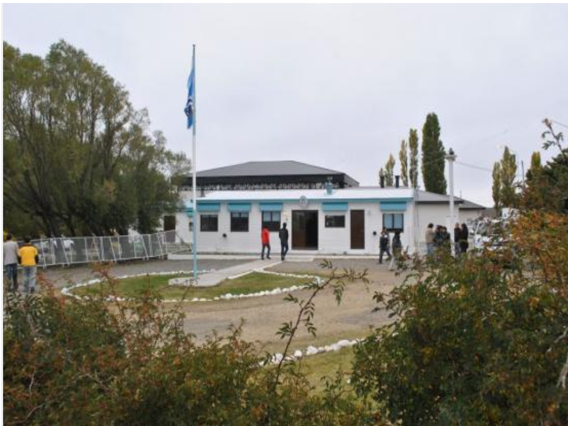
Escuela rural del Paraje Las Vegas

Minutos antes que se realizara el acto en la escuela Rural 26 "Gendarmería Nacional", en el paraje Las Vegas, sorpresivamente desde protocolo del Gobierno de la Nación decidió suspender el acto.