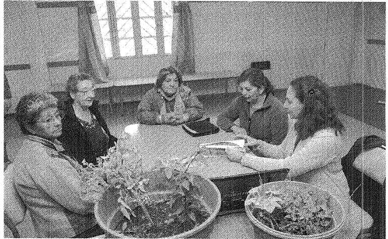
INICIATIVA DEL INTA. VECINOS DEL SAN MARTÍN SE CAPACITAN PARA TENER SU HUERTA ORGÁNICA.

También se asiste a chacras y pequeños emprendimientos vinculados con la huerta orgánica, así como