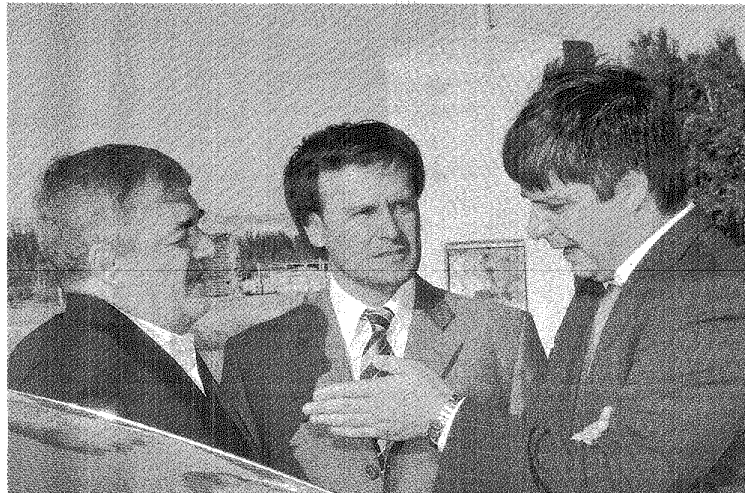
DIÁLOGO. EL INTENDENTE Y CANDIDATO A VICEGOBERNADOR, AYER CON DAS NEVES DURANTE LA RECORRIDA POR UNA OBRA.

Se refirió así a la presentación que el partido hizo para que el peronismo acceda a 16 bancas en la Legislatura y no a 25 como le corresponderían al Frente para la Victoria y al Modelo Chubut. Y habló del voto electrónico y la segunda vuelta.