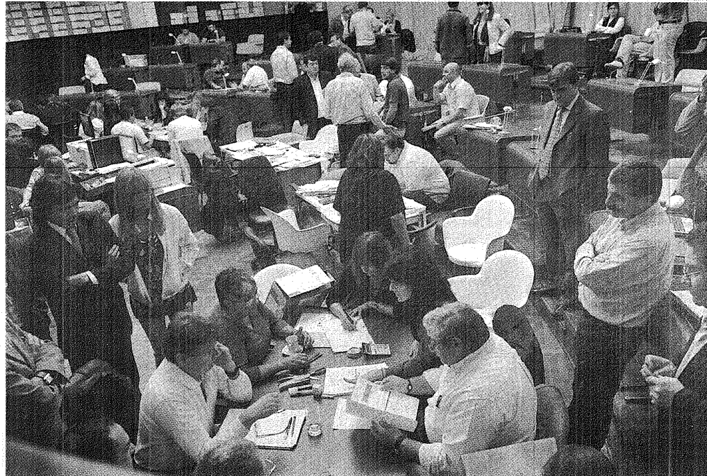
HAY QUE ESPERAR. PESE A LAS EXPECTATIVAS QUE HABÍA, EL TRIBUNAL ELECTORAL DECIDIÓ AGUARDAR QUE EL SUPERIOR RESUELVAN SOBRE TODAS LAS URNAS.

Sin embargo la decisión de postergar el análisis de la posibilidad de convocar a complementarias o no, fue bien recibida por la mayoría de los sectores. Desde la Justicia explicaron extraoficialmente que este