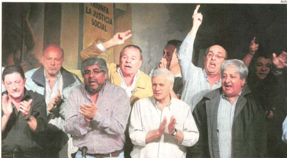
Desde la cúpula de la CGT quieren que los nuevos lugares de los directorios sean para sus hombres.