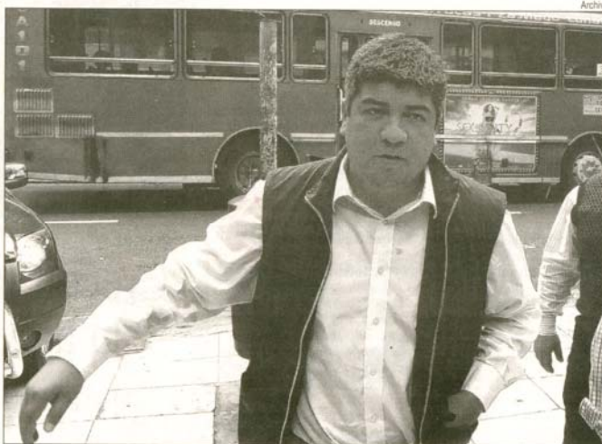
El hijo del titular de la CGT dijo que la relación entre Cristina y Moyano padre “es normal”.