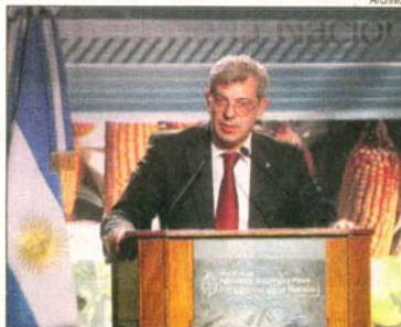
El ministro Domínguez encabezó un remate de soja en Rosario.

El ministro de Agricultura, Julián Domínguez, negó ayer que se esté pensando en la estatización del comercio de granos, aunque abogó por una participación más activa de los capitales nacionales en ese sector, al participar del primer remate de soja de la campaña 2010-2011, en la Bolsa de Comercio de Rosario.