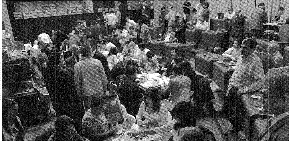
DE NUNCA ACABAR. LOS RECURSOS TRAS EL RECUESTO DEFINITIVO SIGUEN BAJO EL ANÁLISIS DEL SUPERIOR, AUNQUE PARECE QUE PRONTO HABRÁ DEFINICIONES.

El presidente del Tribunal Electoral Provincial estimó que en no más de 10 días se sabrá si ese organismo pide elecciones complementarias. Además aclaró que los reclamos se resolverán en Chubut y no en la Corte Suprema de la Nación.