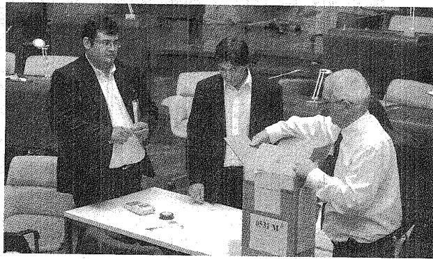
La urna 531 de Comodoro ya fue anulada por el Superior Tribunal de Justicia.

Se trata concretamente de las urnas 174 de Puerto Madryn, 1038 de Camarones, 507, 531 y 1127 de Comodoro Rivadavia. Ya de por sí, estas cinco mesas, que representan sólo el 50% de las impugnaciones a evaluar -por lo que la cifra podría aumentar- comprometen la definición de varias categorías, además de la gobernación provincial, donde el escrutinio definitivo y parcial contabiliza 401 votos de diferencia a favor del candidato del Peronismo Federal (PF), Martín Buzzi, sobre el del Frente