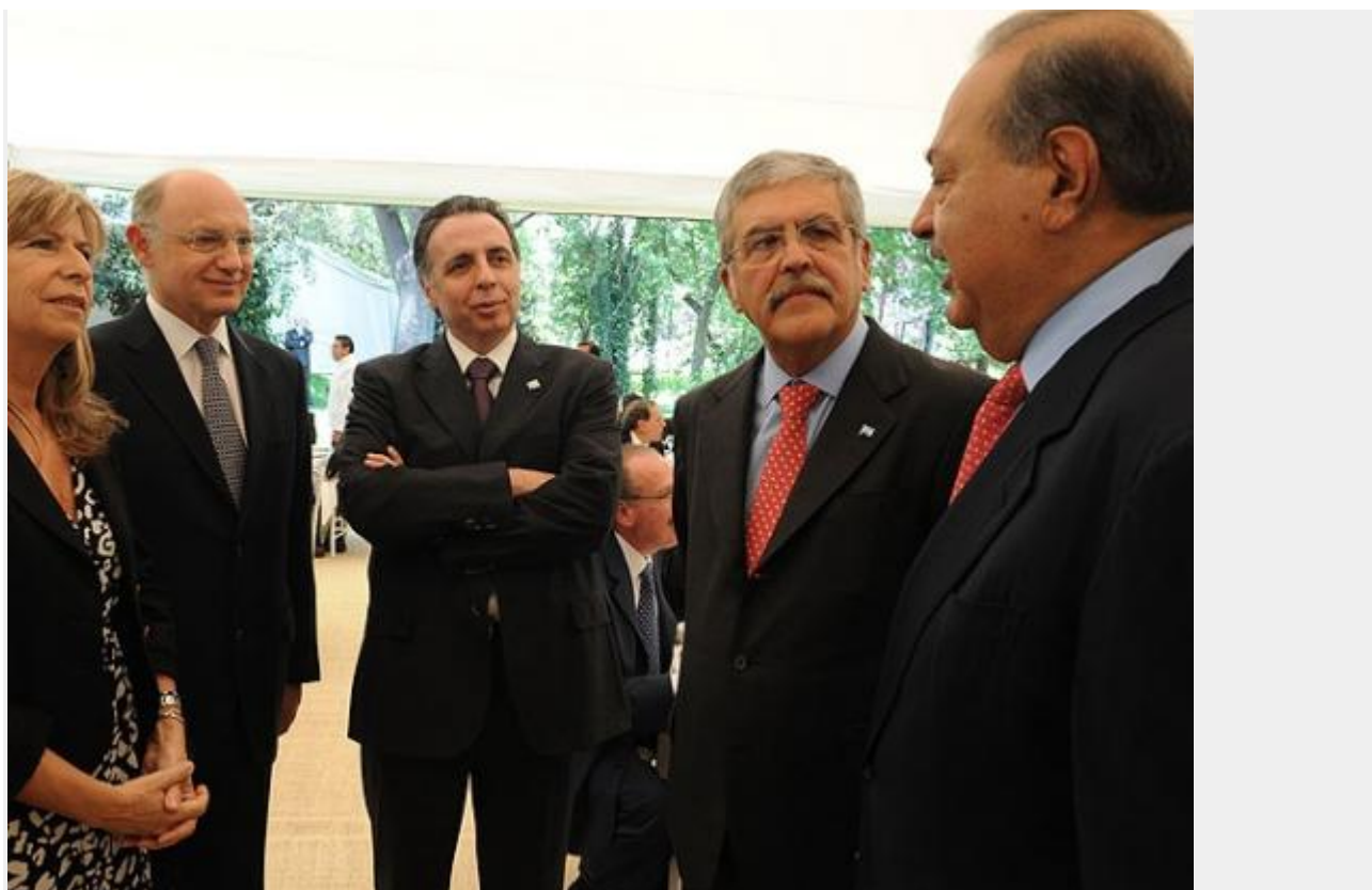
Julio De Vido, junto a autoridades de la canadiense Goldcorp

El ministro de Planificación Federal, Julio De Vido, recibió ayer en México a autoridades de la canadiense Goldcorp, que le anunciaron inversiones en la Argentina por 850 millones de dólares para el proyecto Cerro Negro, en Perito Moreno.