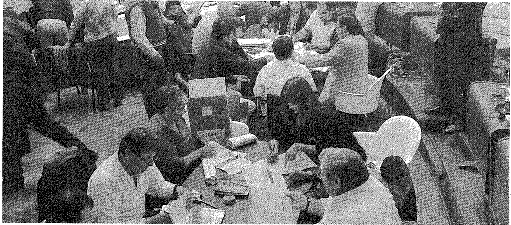
CERCA DEL FIN. SÓLO QUEDAN DOS URNAS BAJO DEBATE LEGAL Y LUEGO VENDRÁ LA DECISIÓN DEL TEP ACERCA DE SI SOLICITA O NO ELECCIONES COMPLEMENTARIAS.

El Superior ratificó la validez de tres urnas de Comodoro Rivadavia y hoy deberá expedirse sobre las últimas dos. En las últimas horas de hoy o las primeras de mañana, el Tribunal Electoral decidirá si llama a elecciones complementarias.