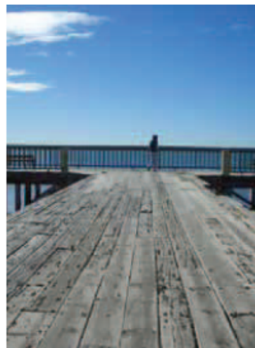
Recorrida por el puerto

Todas estas obras de remodelación y adecuación integral de la estructura del muelle y viaducto de acceso, se suman al nuevo edificio administrativo de la Unidad Ejecutora Portuaria, cuya obra civil se encuentra finalizada y en un lapso no mayor a 60 días se encontraría equipado con mobiliario administrativo completo, señalaron desde la Secretaría de Estado de Transporte. ■