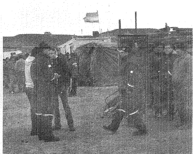
Pese a la intervención del Ministerio de Trabajo y la resolución judicial, los petroleros huelguistas mantienen la vigilia en las rutas.

Su objetivo, corroboró, es conocer todos los requerimientos para buscar la alternativa de solución y para ello ayer dialogó con delegados y dirigentes que