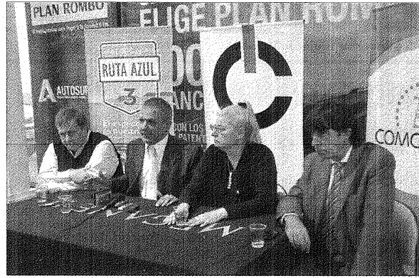
En Autosur, se realizó la presentación del Primer Rally de la Ruta Azul, que tendrá 30 autos en competencia.

"También se estarán sumando 10 autos más el día sábado en Puerto San Cruz, se comienza y termina en