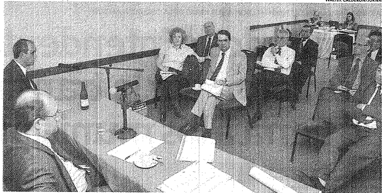
TENSO. ASÍ FUE EL AMBIENTE EN VARIOS MOMENTOS DE LA SESIÓN DEL CONSEJO, QUE ESTÁ EN PLENA EVALUACIÓN DEL JUEZ.