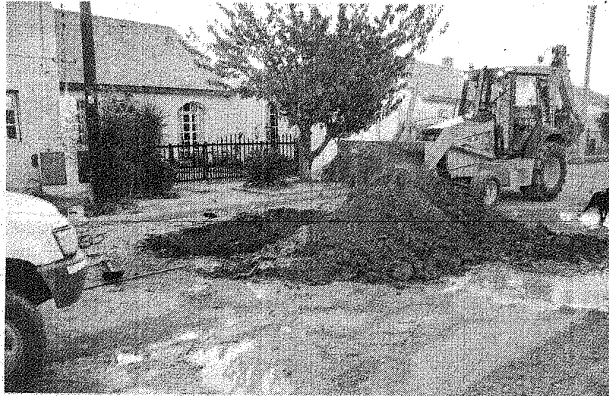
Ya sellado el pozo del que surgía gas, ahora el problema para los vecinos de la calle Los Ferroviarios es una pérdida de agua de grandes dimensiones.

La zona afectada se encuentra en la calle Los Ferroviarios del barrio Las Orquídeas. Se trata del mismo sector donde hace dos meses sus habitantes denunciaron que existía una surgencia de gas en un antiguo pozo de petróleo. La operadora petrolera reconoce que producto de sus tareas de sellado se produjo la rotura de un caño de agua y quiere hacerse cargo de los costos de reparación, pero que el trabajo lo efectúe la Sociedad Cooperativa.