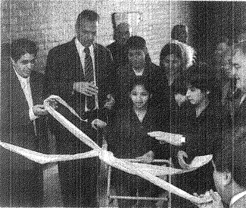
EL MOMENTO DE CORTAR LAS CINTAS EN LA ESCUELA 738 DE COMODORO.