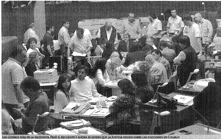
LOS ÚLTIMOS DÍAS DE LA INCÓGNITA. PASÓ EL RECuento Y AHORA SE ESPERA QUE LA JUSTICIA DECIDA SOBRE LAS ELECCIONES EN CHUBUT.

El constitucionalista Daniel Sabsay dijo que "de ninguna manera hubo un fraude generalizado como se pretendió imponer" y si alguien pensó que lo hubo "debió hacer una denuncia penal".