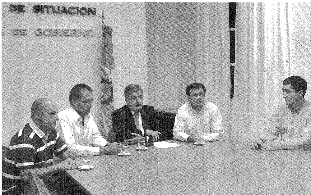
DAS NEVES Y LA FÓRMULA. EN CASA DE GOBIERNO EL GOBERNADOR CONVOCÓ A ELECCIONES COMPLEMENTARIAS EL 29 DE MAYO. "QUEREMOS QUE ESTO SE TERMINE", DIJO.

En conferencia de prensa Das Neves también pidió garantizar la transparencia del proceso: "Ya que hay seis mesas y hay seis ministros" de la corte provincial, "sería importante que cada mesa esté presidida por un ministro".