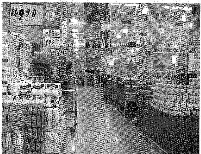
PARA EL GOBIERNO, LA INFLACIÓN DEL MES DE ABRIL SOLO TREPÓ AL 8 POR CIENTO.

Los alimentos que más subieron fueron: zapallito con el 27,3 por ciento; naranja, 15,3 y ají, 10,3; mientras que los que más bajaron fueron: tomate