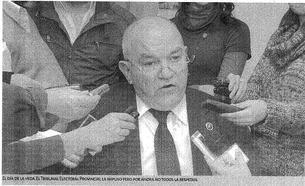
EL DÍA DE LA VEDA. EL TRIBUNAL ELECTORAL PROVINCIAL LA IMPUSO PERO POR AHORA NO TODOS LA RESPETAN.

Alguien dijo alguna vez que "los jueces son políticos con toga". Sin generalizar esta definición, puede decirse que el fallo respecto a las complementarias tuvo más contenido político que jurídico.