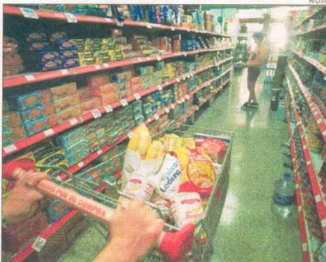
Los alimentos impulsaron el alza de las canastas básica y alimentaria.

En tanto, los valores de las Canastas Básica y Alimentaria están por encima del alza del IPC