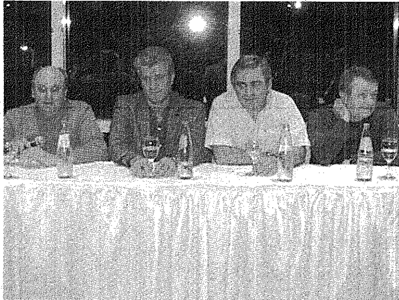
CÚPULA. LA DIRIGENCIA DEL FRENTE DICE QUE TANTO NO SE PUEDE HACER.

Respecto a la expectativa que genera esta nueva elección en el común de los ciudadanos, Eliceche reconoció que existe interés comprobado de la gente por decidir. "Quizás falte información porque hay muchos que pien-