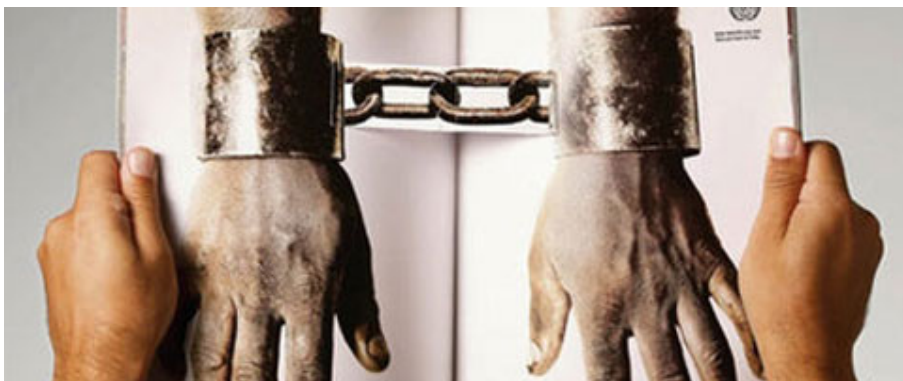
SANCIÓN INTERNACIONAL POR LA DESPARICIÓN DE IVAN TORRES EN CHUBUT