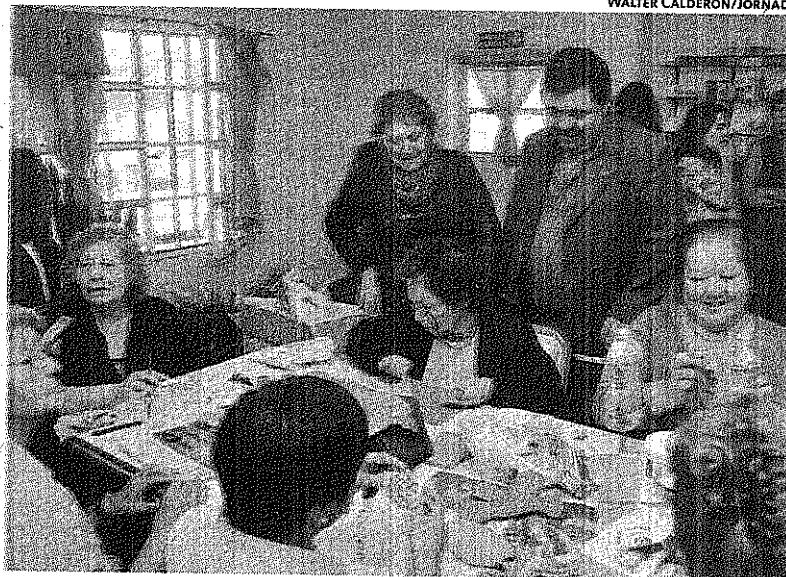
LOS ADULTOS MAYORES TIENEN RESPUESTA Y ACOMPAÑAMIENTO EN EL CENTRO DE DÍA.

El secretario expuso que dadas sus características "éste es el único centro que está funcionando en Chubut de esta manera y es financiado por el