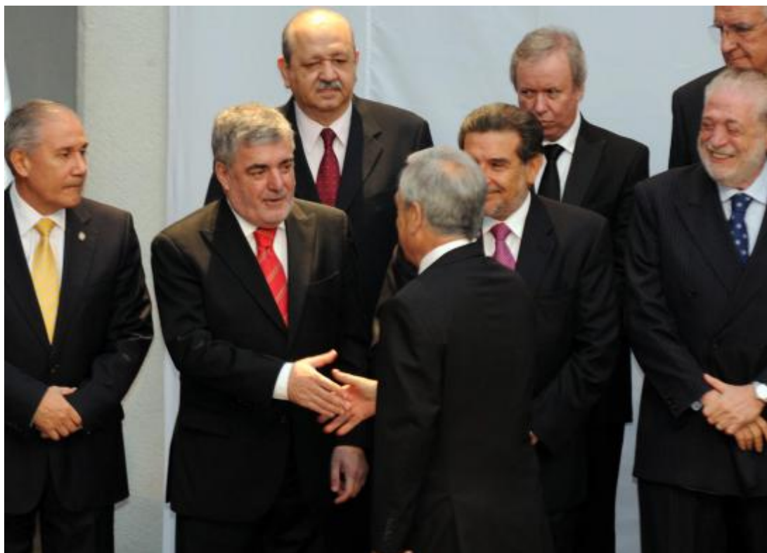
1 -El gobernador Mario Das Neves saluda a Sebastián Piñera.

EL GOBERNADOR PARTICIPO DE ENCUENTRO BINACIONAL EN CHILE CON LA PRESENCIA DEL PRESIDENTE PIÑERA / El gobernador del Chubut, Mario Das Neves, participó ayer del Encuentro Binacional que en Santiago de Chile reunió a gobernadores argentinos e intendentes chilenos con frontera común y del que también tomaron parte los embajadores Ginés González García y Adolfo Zaldívar y los Cancilleres Alfredo Moreno y Héctor Timerman, entre otros, y en el que la delegación argentina fue recibida por el presidente chileno, Sebastián Piñera.