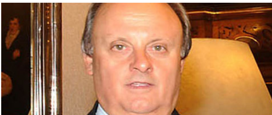
DENUNCIA DE DI PIERRO