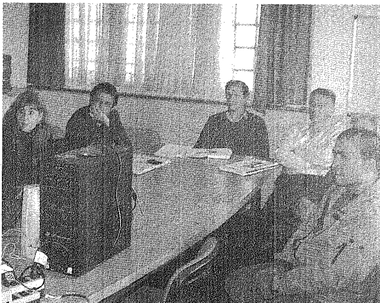
"AUDIOTECA: LEER ESCUCHANDO", FUE MOTIVADA POR SECTORES DE LA COMUNIDAD.