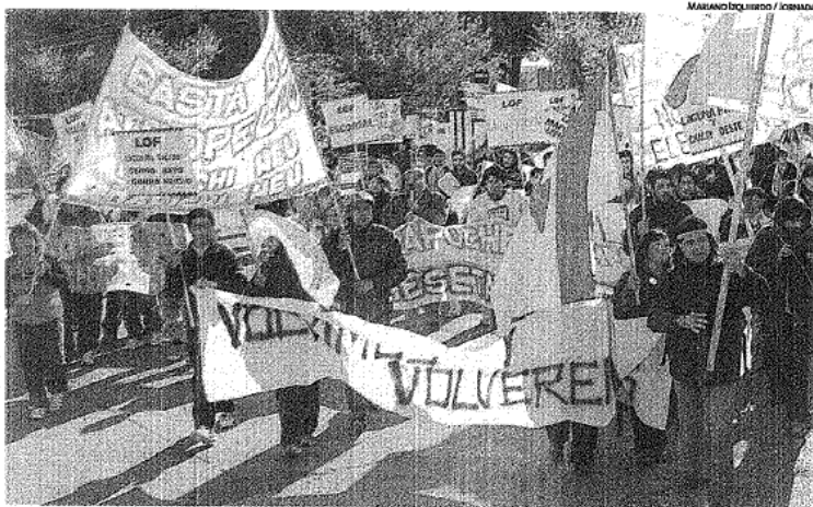
ORGANIZADOS. HUBO VARIOS TESTIGOS DE CÓMO LOS MAPUCHES SE BAJARON DE AUTOS MODERNOS PARA PREPARARSE.