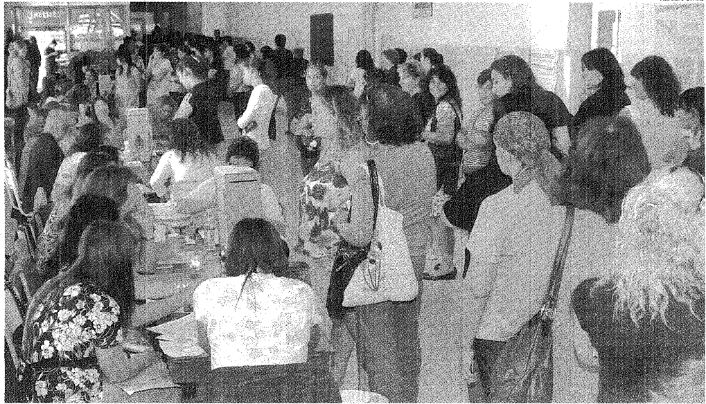
PARA INFORMARTE MEJOR. LA CARTA QUE ENVIO LA ORGANIZACIÓN SERÁ RECIBIDA POR LAS CASI 2 MIL PERSONAS QUE DEBERÁN VOTAR DE NUEVO EL PRÓXIMO DOMINGO.

La despachó el sábado la ONG Poder Ciudadano, que será observadora externa en la nueva elección que se hará el domingo próximo. Se espera que llegue a Comodoro, Madryn y Camarones entre el jueves y el viernes.