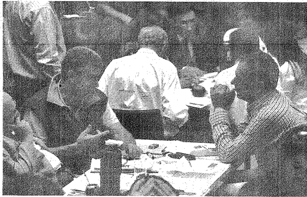
Finalmente, en seis días se conocerá si el próximo gobernador de Chubut será Carlos Eliceche o Martín Buzzi.

Voluntariamente, o no, el artífice de la frustración política del gobernador chubutense vol-