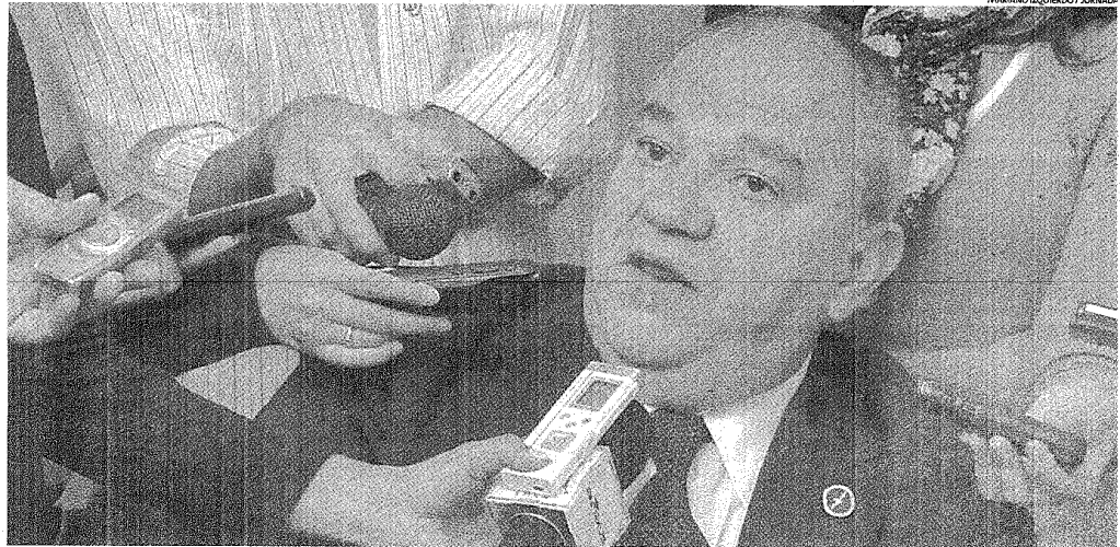
EN EL CENTRO DE LA ESCENA, PFLIEGER EXPRESÓ UNA POSTURA FIRME EN RELACIÓN CON EL PRESUPUESTO Y LA POLÍTICA SALARIAL DEL SUPERIOR TRIBUNAL DE JUSTICIA.

"Hemos abandonado la estrategia de la conversación informal", aseguró, en alusión a las negociaciones con el Ejecutivo. Además dijo que no "prohibirá ni bendecirá" medidas de fuerza por parte de los empleados judiciales.