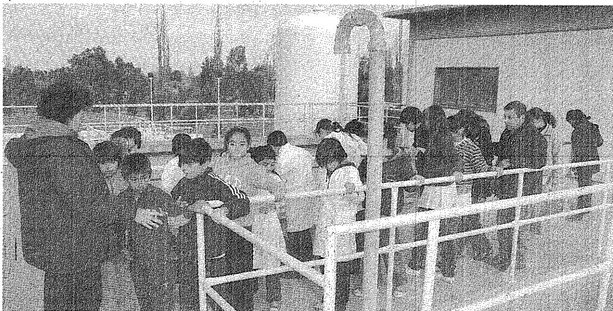
PARTE DEL RECORRIDO QUE HICIERON LOS ALUMNOS DE LA ESCUELA 185 QUE FUERON NOMBRADOS "GUARDIANES DEL AGUA"

U nos veinte alumnos de quinto grado de la Escuela 185 del Barrio Gregorio Mayo visitaron la planta potabilizadora de la Cooperativa de Servicios Públicos de Rawson para interiorizarse sobre el proceso de potabilización del agua como del cuidado que se debe hacer del vital líquido.