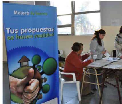
Vecinos de Caleta Olivia eligieron obras a concretar.

La etapa de votación del programa municipal "Mejorá tu Barrio", llegó para los barrios Centro y 26 de Junio. Los vecinos se manifestaron en función de los proyectos, a los cuales asignaron Presupuesto público. Los participantes reclamaron mayor compromiso de parte del resto de los ciudadanos.