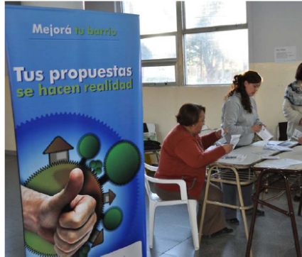
Vecinos de Caleta Olivia eligieron obras a concretar.

La etapa de votación del programa municipal "Mejorá tu Barrio", llegó para los barrios Centro y 26 de Junio. Los vecinos se manifestaron en función de los proyectos, a los cuales asignaron Presupuesto público. Los participantes reclamaron mayor compromiso de parte del resto de los ciudadanos.