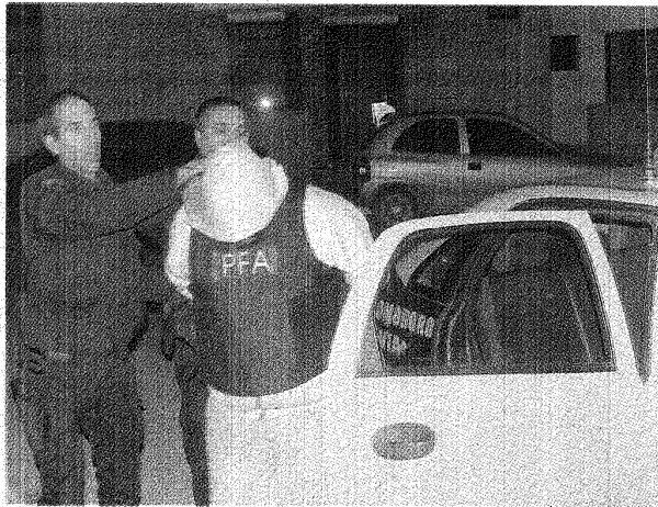
El "cerebro" de la organización arribó detenido la noche del lunes al aeropuerto de Comodoro Rivadavia bajo un fuerte dispositivo de seguridad.

El principal sospechoso y "cerebro" de la organización estaba prófugo de la Justicia con pedido de captura internacional por una causa de 500 kilos de marihuana.