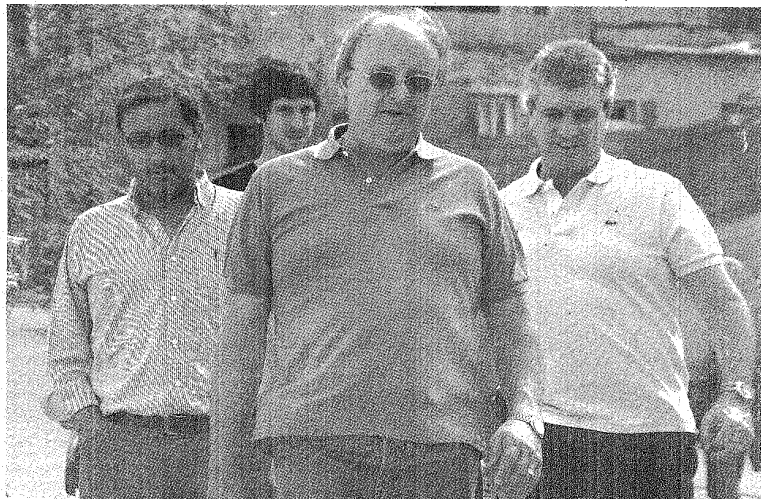
El próximo intendente de Comodoro nunca interrumpió su relación con el Gobierno nacional.

El intendente de Trelew ha visualizado lo que es obvio: el Modelo Chubut asumirá el Gobierno provincial el 10 de diciembre y quedará como una isla en medio de una Legislatura kirchnerista y de un Gobierno nacional con grandes chances de seguir siendo del mismo signo.