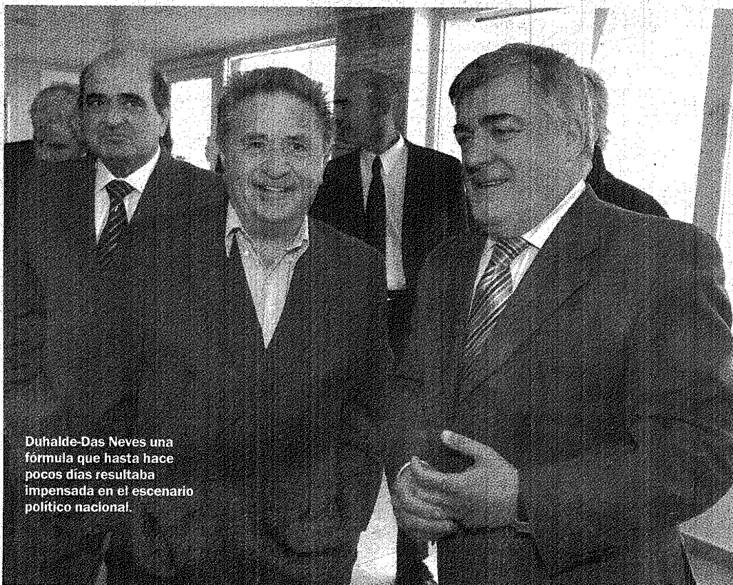
Duhalde-Das Neves una fórmula que hasta hace pocos días resultaba impensada en el escenario político nacional.