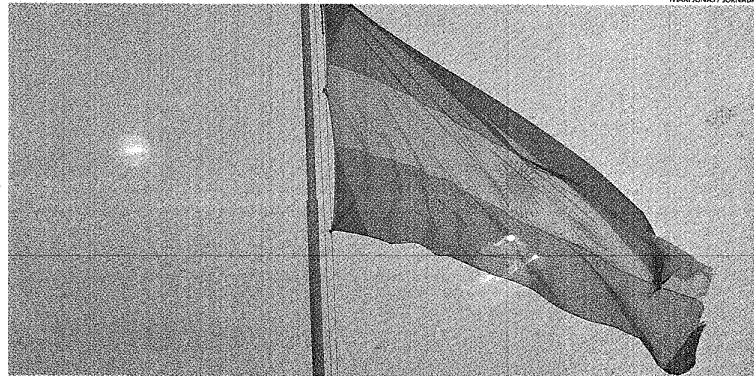
ALTA EN LA CENIZA. LA BANDERA ARGENTINA FLAMEA BAJO UN CIELO CUBIERTO DE POLVO DEL VOLCÁN PUYEHUE.