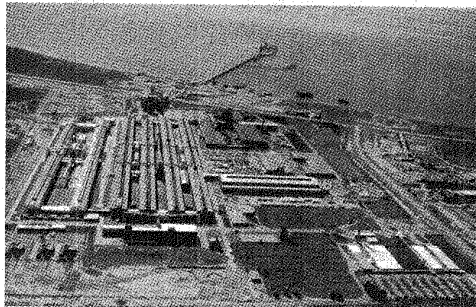
Investigan posibles casos de contaminación en la planta procesadora de aluminio de Aluar, en Puerto Madryn.

La resolución autoriza a liquidar a favor del Juzgado Federal de Rawson (donde se realizó la denuncia en 1997 y desde donde se sistematiza el estudio) la suma total de 326.329,50 pesos. El Juzgado deberá rendir cuenta documentada