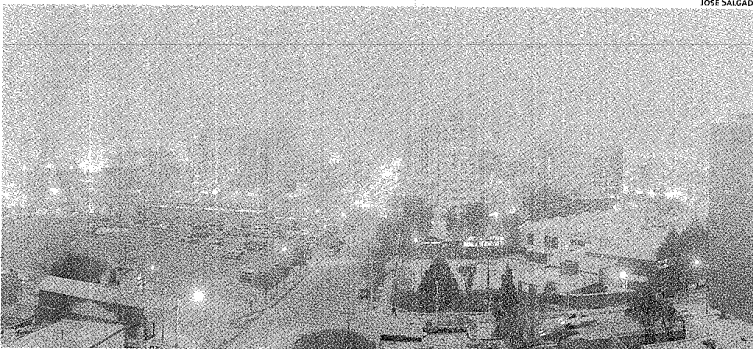
POR LA CENIZA Y EL VIENTO DEBIERON SUSPENDERSE LAS CLASES HOY.

la población", agregando que desde gobierno se trabajó para que "estos nosocomios tengan los materiales que se necesitan para atender a cualquier persona que tenga algún grado de irritación o de situación sanitaria".