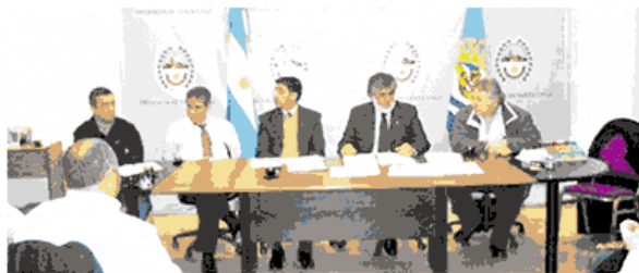
Los delegados del sector destacaron la importancia del diálogo en la búsqueda de soluciones.